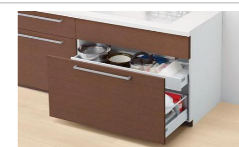
飾り板+1段引き出し