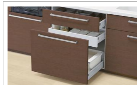
2段引き出し(内引き出し付き)