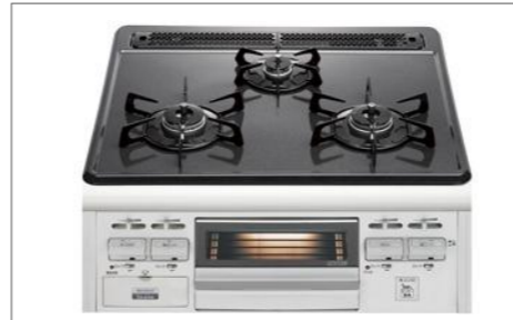
ホーロートップ片面焼きコンロH: シルバー