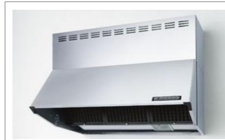
シロッコファンフード: シルバー