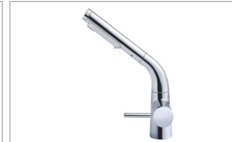
水ほうき水栓(ハンドシャワー式・エアイン)