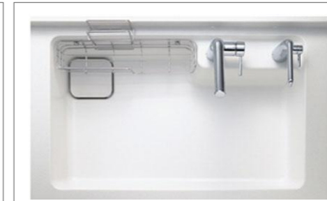
すべり台シンク: ホワイト